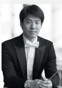
(提供)札幌交響楽団

2019年4月から札幌響指揮者として道内はもちろん各地で共演を重ね、2020年10月に指揮研究員を務めて指揮者としての才能を開花させる礎となった東京シティ・フィルの定期演奏会に、2021年2月に読売日響に、9月には大阪フィル定期演奏会にもデビュー。日本各地のオーケストラへと活躍の場を大きく広げて堂々たる演奏を披露している、これからの音楽界を担う期待の若手指揮者の一人であり、その瑞々しい感性から引き出される音楽から目と耳が離せない注目の存在である。